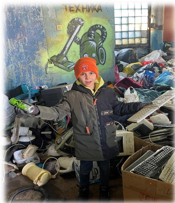
Пункт приема вторсырья "Фракция"

Собирай чистые, сухие упаковки, чтобы они занимали меньше места – сомни их.