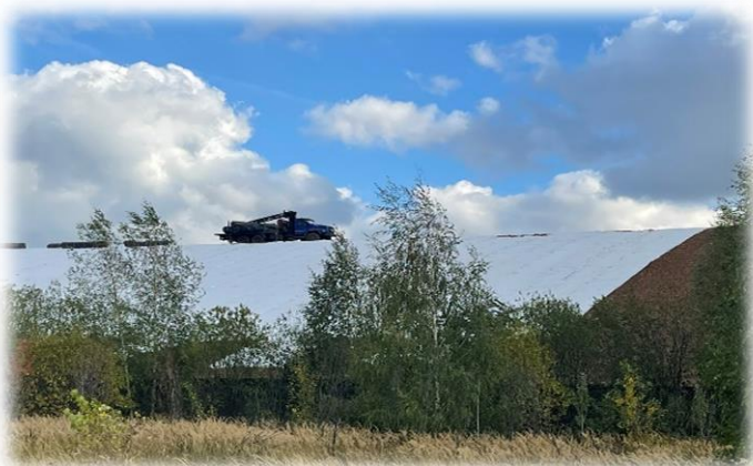
Этот холм - Самосыровский полигон ТБО его накрывают геомембраной, затем привезут чернозем и посадят деревья

Я подумал, что важно, чтобы каждый человек понимал - от него зависит будущее нашей планеты и решил написать в газету, чтобы как можно больше людей снова задумались об экологии.